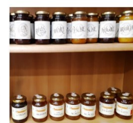
CONFETTURE MARMELLATE E MIELE