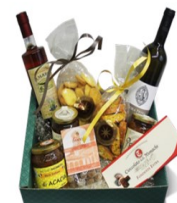
CONFEZIONI PACCHI NATALIZI