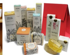
CONFEZIONE PRODOTTI FITO- COSMESI