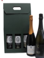
CONFEZIONE REGALO VINI