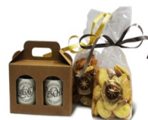
CONFEZIONE REGALO MARMELLATE E BISCOTTI